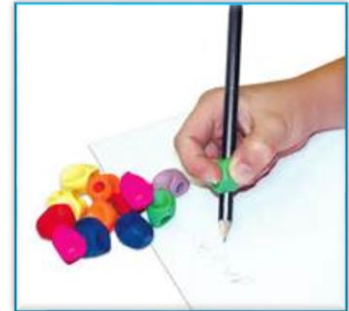
MINI PENCIL GRIP

Cette prise est faite pour les petits doigts. Elle est parfaite pour apprendre aux enfants à bien tenir leur crayon.