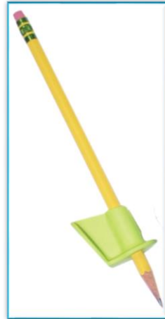
START RIGHT GRIP

La texture rigide de cet outil maintient le pouce et l'index dans la bonne position, empêchant ainsi le croisement des doigts, sans déformer la prise de crayon.